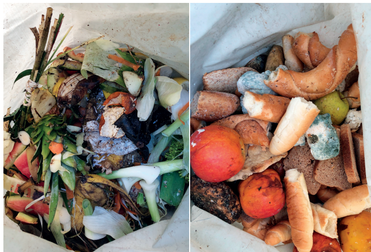
Obr. 3. Zahradní (vlevo) a gastro (vpravo) bioodpad Fig. 3. Gardening (left) and food (right) biowaste

Kontejnery nikdy nebyly plné a lze říci, že četnost vyvážení je optimálně nastavená. Jako problematické se jeví ponechávání bioodpadů v plastových sáčcích nebo zeleniny a ovoce v původním plastovém obalu, v kterém jsou prodávány. Často se v kompostejnerech nacházel SKO. Další komplikací je znečištění kontejnerů po vyprázdnění, kdy zejména v teplých ročních obdobích je doprovázeno znatelným výskytem hmyzu.