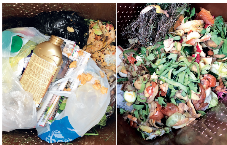
Obr. 4. Bioodpad s příměsí SKO (vlevo) a čistý bioodpad (vpravo) Fig. 4. Biowaste with MSW (left) and clean biowaste (right)

Obsah bioodpadu v SKO byl oproti analyzovanému SKO z Prahy 1 a z Újezdu nad Lesy až o 5 % nižší. V případě Újezdu nad Lesy zvýšené množství bioodpadu představuje zahradní odpad jako listí, posekaná tráva, pařezy, větve a to i přes to že i zde je propagováno domácí kompostování a možnost pronájmu kompostejneru. V Praze 1 je zvýšené množství „gastro“ odpadu v bioodpadu způsobeno velkým množstvím restaurací, prodejen rychlého občerstvení a ubytovacích zařízení pro turisty. Z rozboru SKO ze sídlišť Prahy 15 je vidět, že obyvatelé mají povědomí o důležitosti třídění bioodpadu, ale stále jsou zde rezervy jak sběr zlepšit. Je častým jevem, že bioodpad je vytříděn zvláště v sáčku, nicméně zůstane v SKO. Domníváme se, že je to způsobeno specifícností tohoto druhu odpadu, který rychle podléhá rozkladu. Vznikající zápach a výskyt hmyzu spojený s neochotou minimálně denního vynášení zabraňuje lepšímu třídění. Možným řešením by mohly být nezaměnitelné biologicky rozložitelné sáčky jako v Paříži, které by mohly být dostupné v supermarketech, domácích potřebách nebo obecním úřadě tak jako v Bruselu.